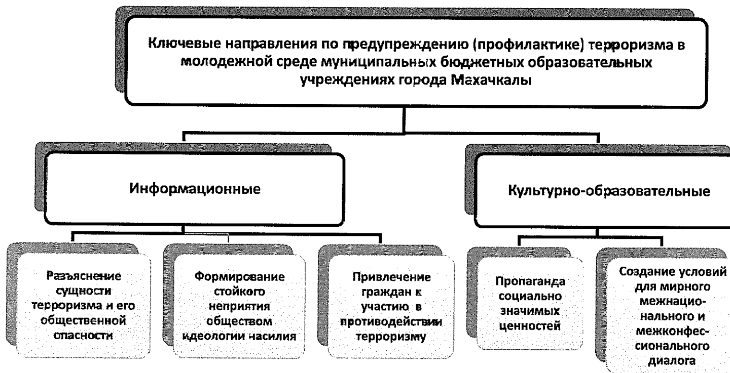
Рис.1. Ключевые направления по предупреждению (профилактике) терроризма

Перечисленные выше направления реализации Комплексного плана предполагают следующие форматы проведения мероприятий: - информационно-просветительские мероприятия по антитеррористической тематике; подготовка произведений (в том числе печатных и аудиовизуальных) по вопросам - профилактики терроризма; - внедрение в обучающие программы (в том числе программы повышения квалификации) для педагогических работников; - тематические конкурсы для СМИ.